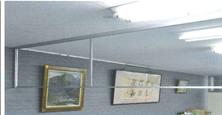
透明性:ガラス越しの絵画も文字もはっきり見えます。 平滑性:ガラスに反射する蛍光灯の明かりも歪みません。